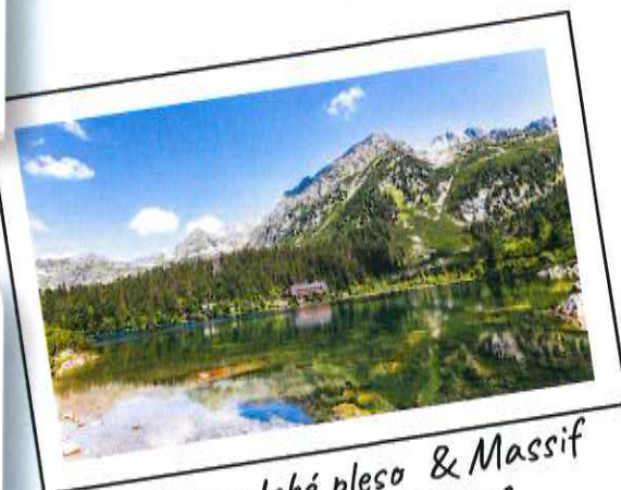
Lac Popradské pleso & Massif des Hautes Tatras