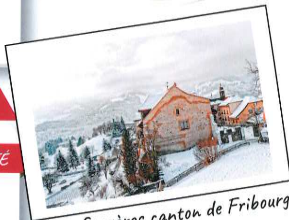
Gruyères canton de Fribourg